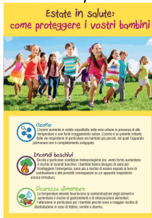
4 - Come proteggere i vostri bambini