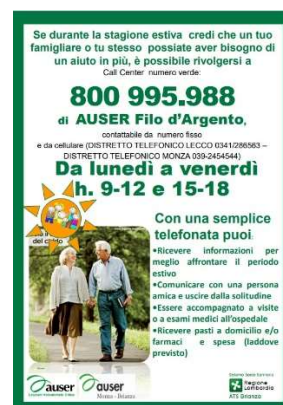
15 - AUSER