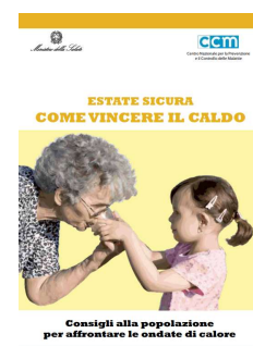
6 - Consigli alla popolazione per affrontare le ondate di calore