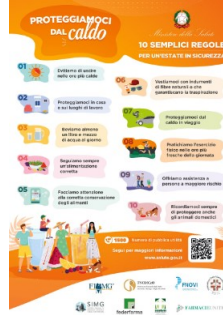
2 - 10 Regole