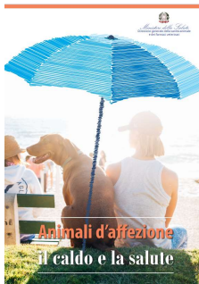
7 - Animali di affezione