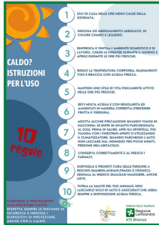
1 - Caldo? Istruzioni per l'uso

Sul sito del Ministero della salute, sono inoltre riportati opuscoli sia di carattere generale (consigli per proteggersi dal caldo), sia di carattere specifico (es. cura degli animali di affezione, viaggiare sicuri ecc.). Gli opuscoli, che saranno messi a disposizione sulla pagina informativa del sito di ATS Brianza, sono: