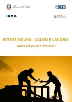
13 - Caldo e lavoro