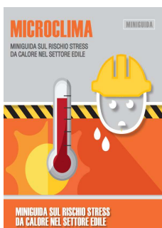
10 - Rischio Stress da calore nel settore edile