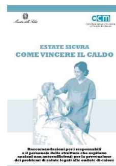
12 – Assistenza nelle strutture