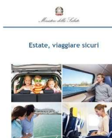
11 – Viaggiare sicuri