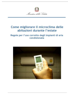
5 - Come migliorare il microclima nelle abitazioni durante l'estate