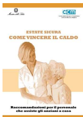
14 - Assistenza a Casa materiale disponibile in diverse lingue (ITA, ENG, RO, FR, PO, RUS)