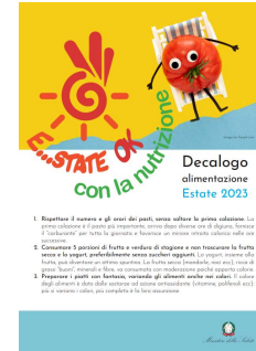
3 - Decalogo Alimentazione